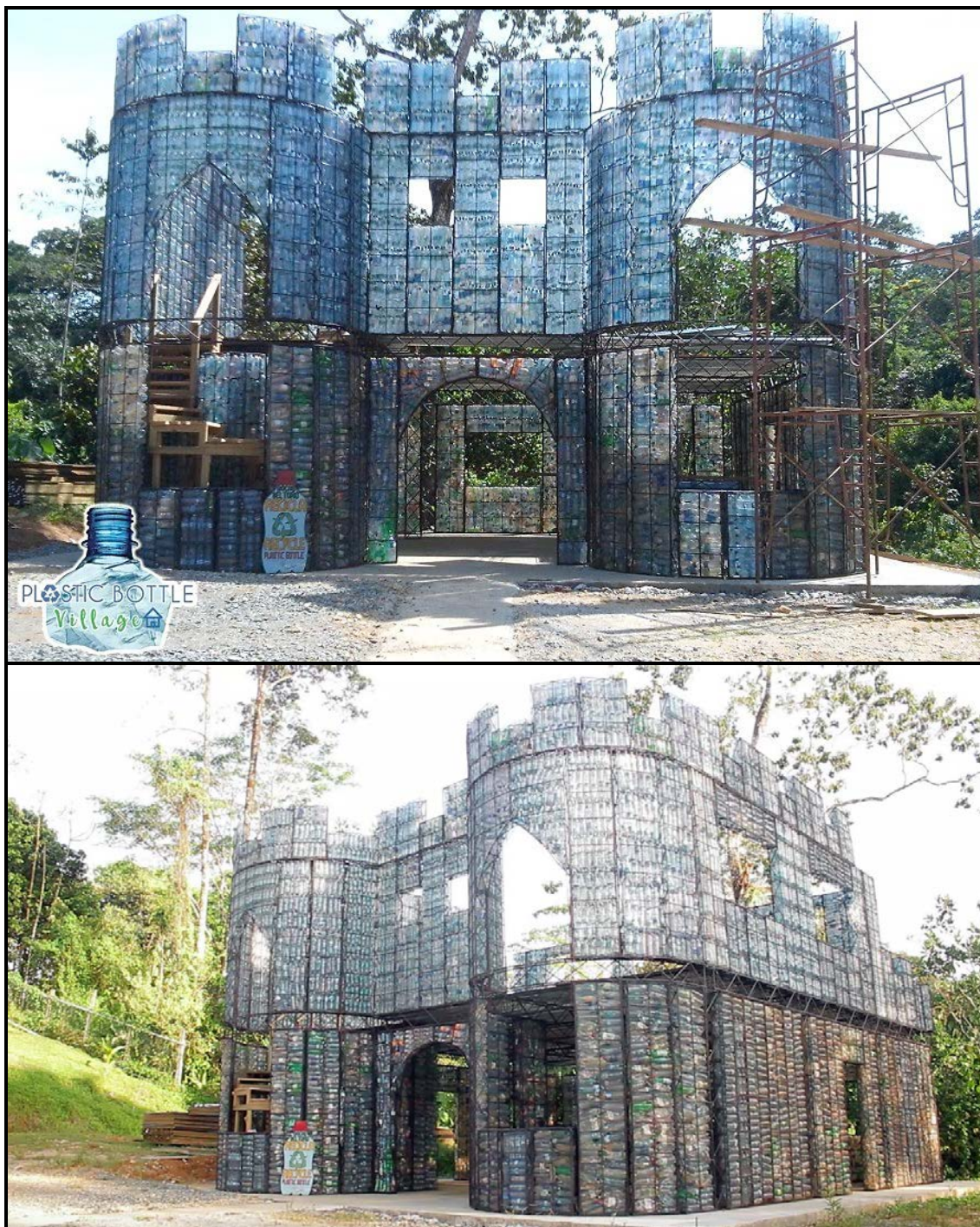
FIGUUR L: Plastiek-dorpshuis deur Isla Colon (Panama), 2016.

Doeltreffende volhoubare ontwerp oplossings voldoen aan die beginsels van sosiale, ekonomiese en ekologiese volhoubaarheid.