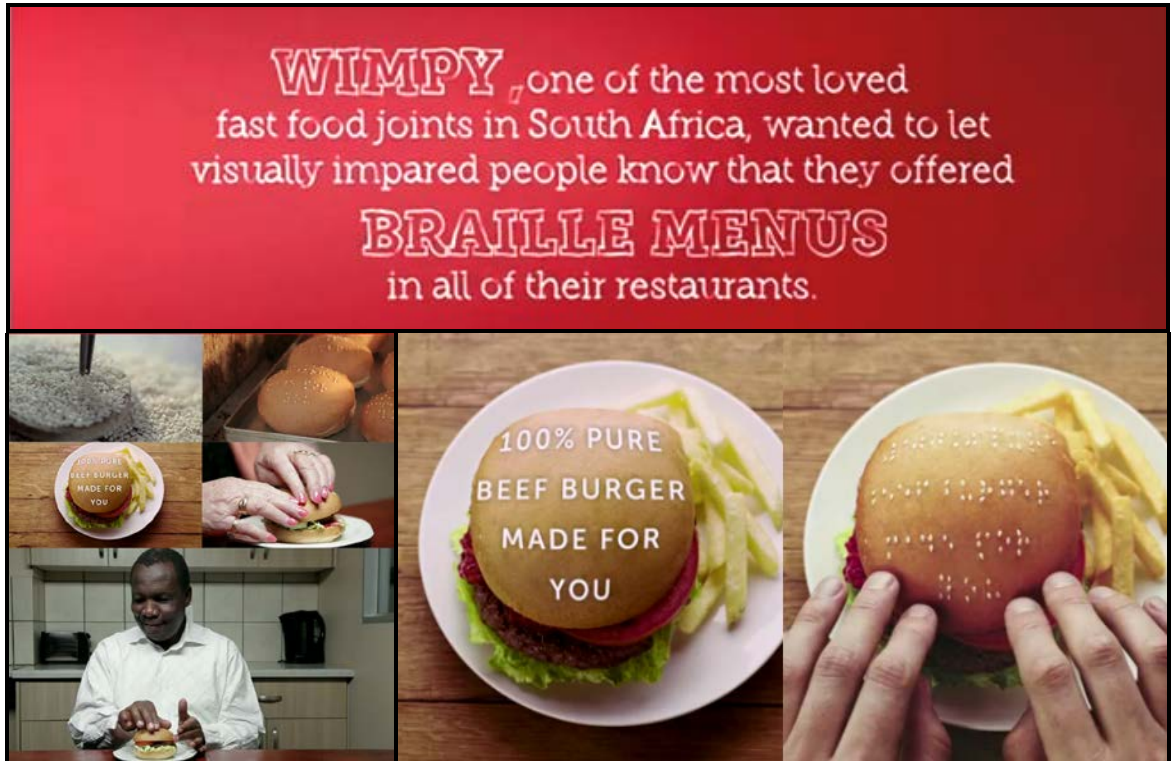
FIGUUR J: Die Wimpy Braille-veldtog deur Metropolitan Republic (Suid-Afrika), 2016.