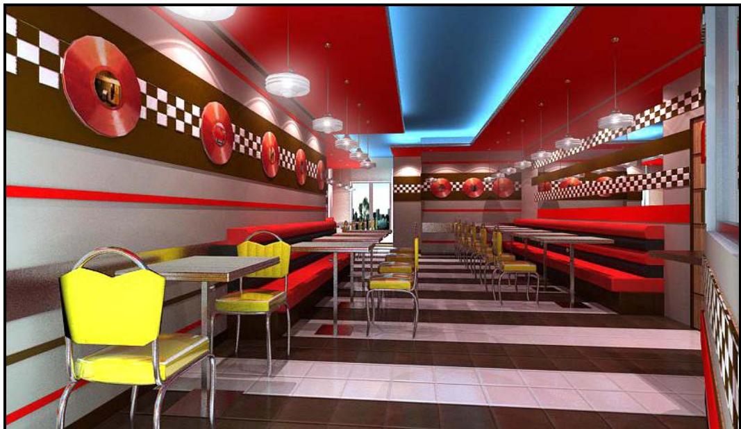
FIGUUR E: Voorgestelde restaurant deur Kylie Shamini (Turkye), 2016.

In 'n opstel (ten minste EEN bladsy) vergelyk die binneontwerp van FIGUUR D met dit van FIGUUR E hierbo.