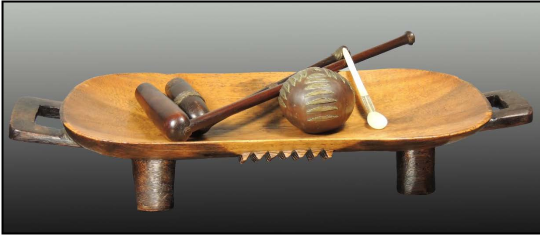
FIGUUR K: Tradisionele Nguni-produkte (Suid-Afrika), 1985.